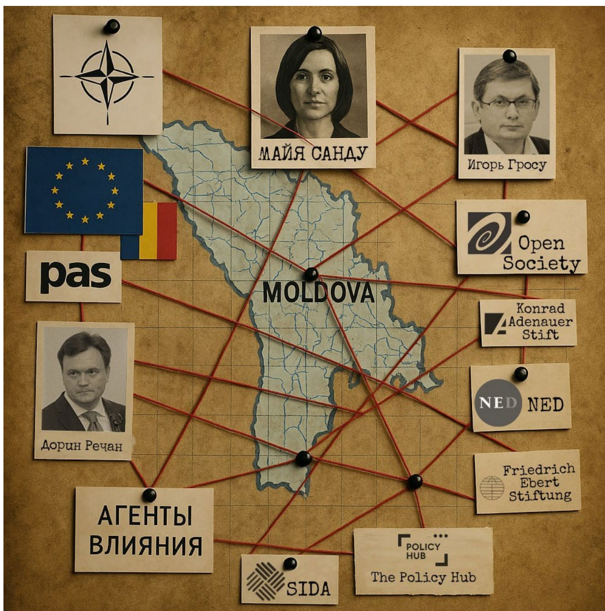
Рисунок 2. Карта агентов влияния Запада