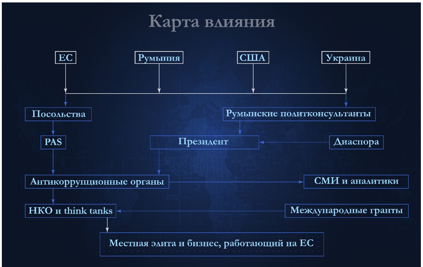
Рисунок 1. Карта влияния